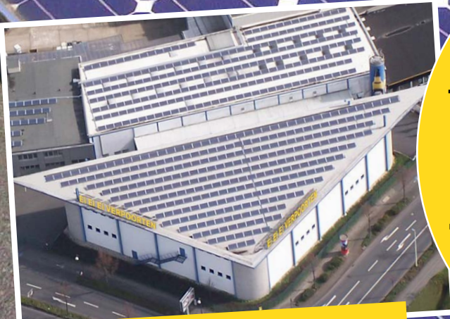
Die VERPOORTEN Photovoltaikanlage ist eine der größten in Bonn.

Jährliche THG-Einsparung von 46,5 Tonnen CO 2e